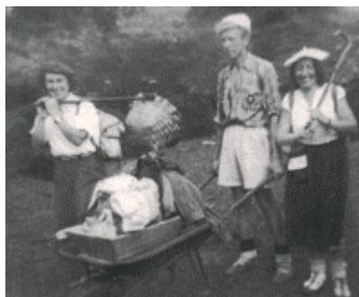
ACARREANDO MATERIAL. REFUGIO; EL 14 DE MAYO DE 1950 SE CONCEDE LA AUTORIZACION POR PARTE DEL AYUNTAMIENTO DE CEANURI PARA LA CONSTRUCCION DEL REFUGIO EN LAS CAMPAS DE ARRABA

Durante sus 55 años de existencia el Grupo Alpino Ganguren ha conseguido que el número de socios aumente paulatinamente. Además de fomentar su afición a la montaña este grupo montañero ha impulsado diversas actividades culturales en la localidad, llegando a configurarse como una seña identificativa de Galdakao.