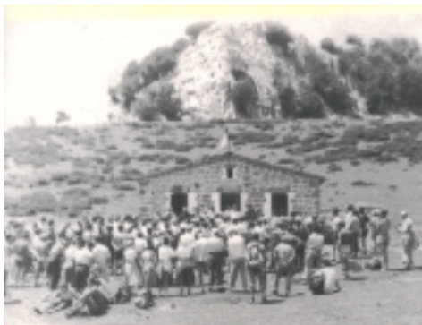
INAGURACION DEL REFUGIO

REFUGIO TERMINADO. DESPUES DE TODO EL ESFUERZO LA OBRA ESTABA TERMINADA A MEDIADOS DE 1952, NO OBSTANTE LA INAGURACION OFICIAL SE PRODUJO EN MAYO DE 1953