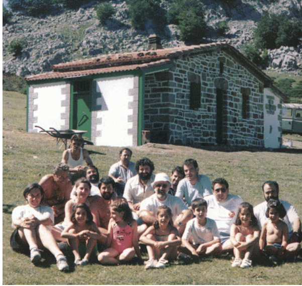
VERANO DE 1990, REFUGIO HOY EN DIA