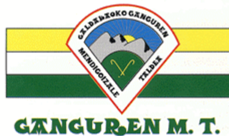
ESCUDO DEL GRUPO ALPINO GANGUREN

El monte es uno de los elementos más característicos de nuestro pueblo, Euskadi siempre ha sido eminentemente montañoso, que queda reflejado en Galdakao a través del Grupo Alpino Ganguren, cuyo fin entre otros es conocer los montes de Euskadi.