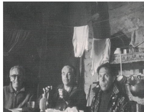
EN EL INTERIOR