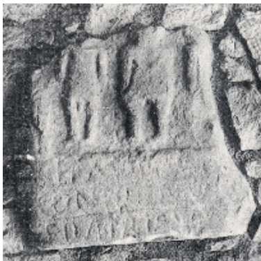
ESTELA EPIGRAFICA DE OBISPOETXE

La benignidad del clima y su orientación al sur protegiéndoles de los vientos del Norte, propició el paso de una sociedad trashumante a otra más estable. Signo de ello es la estela epigráfica de OBISPOETXE , que además testimonia la influencia romanizante en la zona.