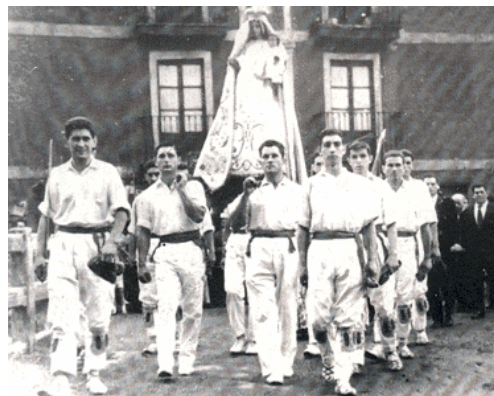
HASIERAKO ANDRA MARI ETXEBARRIN

El 1 de marzo de 1971 el grupo se constituye como Sociedad Artístico – Cultural tomando como fines principales el aprendizaje y la posterior difusión de las danzas y melodías tanto corales como instrumentales de nuestro país así como cualquier otra actividad folklórica que se considere de interés.