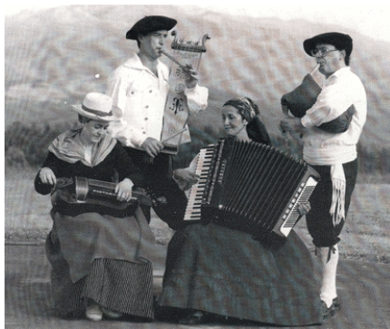
MUSIKARIAK ETA TRESNA BEREZIAK

Dentro del apartado musical se han recopilado gran cantidad de melodías y canciones, así como un importante número de instrumentos que desde hace muchos años no se utilizaban en nuestra música popular como la Txirula, el Ttun –ttun, Zarrabete, Txilibitu, Rabel, Atabal, Espineta, etc.