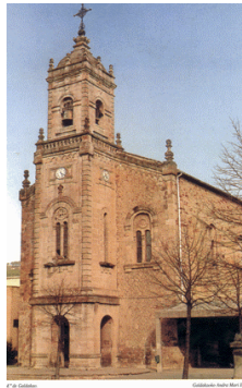
IGLESIA SANTA MARIA DE GALDAKAO

Según diversas fuentes los materiales que se emplearon para construir esta iglesia provenían de la antigua Torre de Torrezabal Otras fuentes orales atestiguan que para la construcción de este templo se aprovecharon las ruinas que quedaban de una Torre o Castillo que existió junto a una antigua calzada que existía en Elexalde.