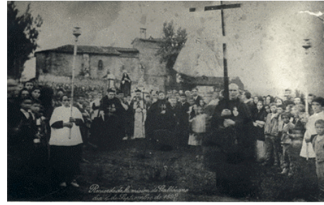
FACHADA POSTERIOR DE LA IGLESIA ELEXALDE EN UN ACTO RELIGIOSO DE 1892