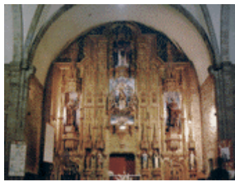
RETABLO DE SANTA MARIA DE GALDAKAO