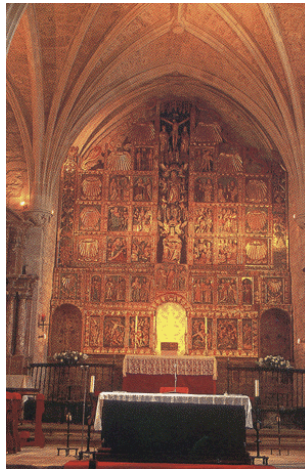
RETABLO: RETABLO PLATERESCO REPRESENTANDO DIVERSAS ESCENAS RELIGIOSAS QUE HA SIDO RESTAURADO RECIENTEMENTE EN SU TOTALIDAD.