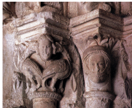
DETALLE DE LA PORTADA