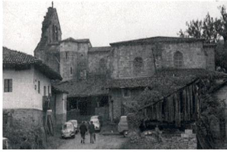
IGLESIA DE SANTA MARIA DE ELEXALDE